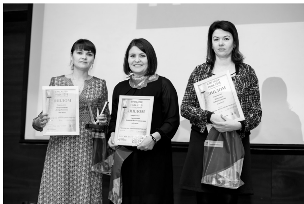
Победители конкурса в бюджетной сфере