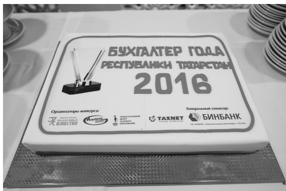
После церемонии награждения всех участников конкурса ждал сюрприз – большой и вкусный торт!

Ответы на тесты, списки победителей и номинантов размещены на сайте www.nalog-iz.ru .